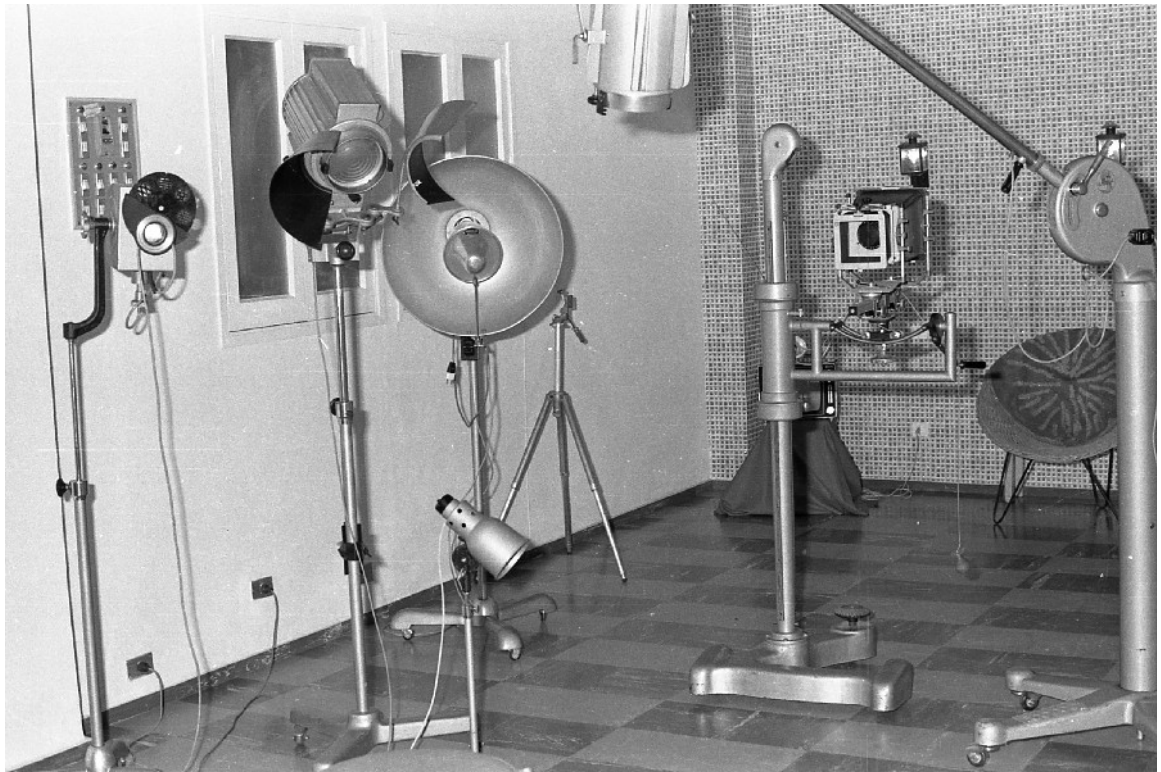
ESTUDIOS DE PACO RIVERO AÑOS 70 SIGLO XX.