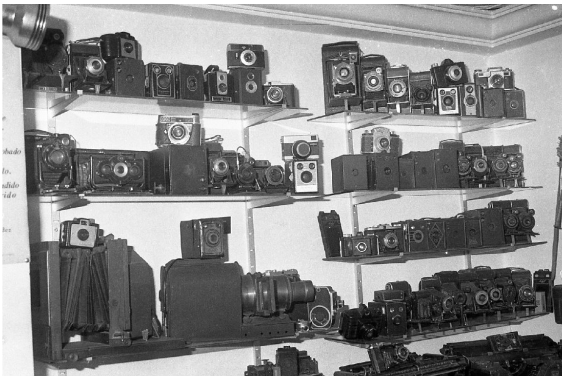
Colección de cámaras fotográficas de Paco Rivero hoy propiedad de la Fundación Canaria Néstor Álamo