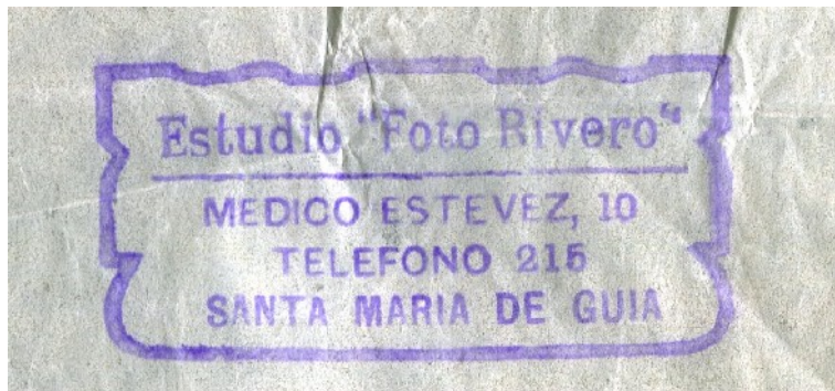
Sello de tinta del estudio de Paco Rivero Años 60 siglo XX