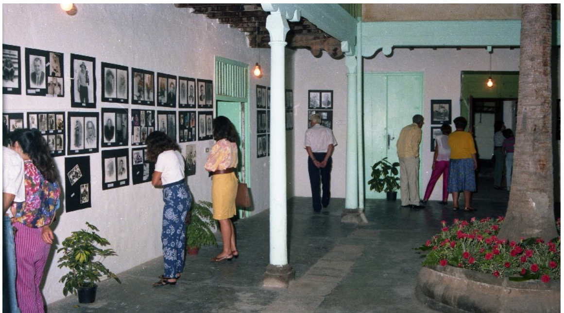
EXPOSICIÓN DE PACOC RIVERO EN GUÍA AÑOS 80 SIGLO XX