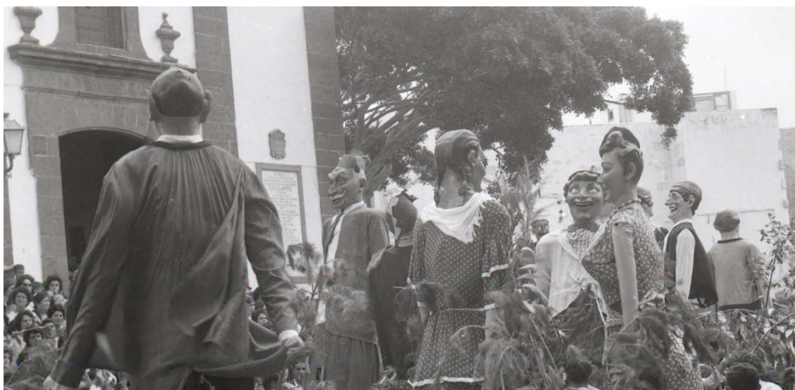
Foto años 60 siglo XX de Paco Rivero (Archivo Mayordomo de Las Marías)

De este modo el Ayuntamiento de Guía va adquiriendo papahuevos hasta hacerse con un nutrido número de ellos, de tal manera que en la fiesta de 1956 se indica en la prensa cuando se informa de la Las Marías «que otro detalle colorista de estos extraordinarios festejos populares es el de los gigantes y cabezudos-nuestros tradicionales “papahuevos”- que en número de veinte y uno figurarán en medio de la rama contagiando con su alegría a chicos y grandes» 4 . En resumen, los papahuevos en Guía de Gran Canaria como se constata se han convertido en un número inherente a sus fiestas.