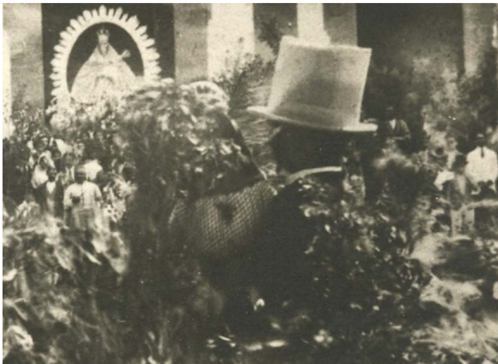
Foto de las primeras décadas del siglo XX de autor desconocido (cedida por Antonio García Ramos).

En Canarias son muchas las referencias documentadas de la participación de gigantes y cabezudos en las fiestas locales desde el siglo XVIII, si bien, hay que tener en cuenta que estos son denominados de diversas maneras: gigantes y cabezudos, papagüevos, gigantones, gigantes y enanos, papahuevos, mascarones, nanos etc. En el caso de Guía las fotografías más antiguas que se conservan de los papahuevos, son curiosamente, de las Fiesta de la Rama de Las Marías.