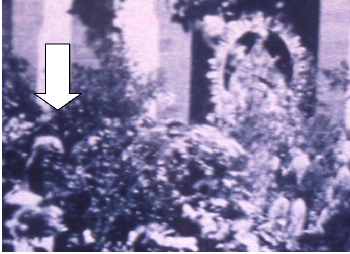
Foto de las primeras décadas del siglo XX de autor desconocido (Archivo Mayordomos de Las Marías).

Con el paso de los años la prensa no siempre cuando informa de los actos de fiestas cita la presencia de papahuevos, y además, varía la forma de denominarlos. En los años veinte del citado