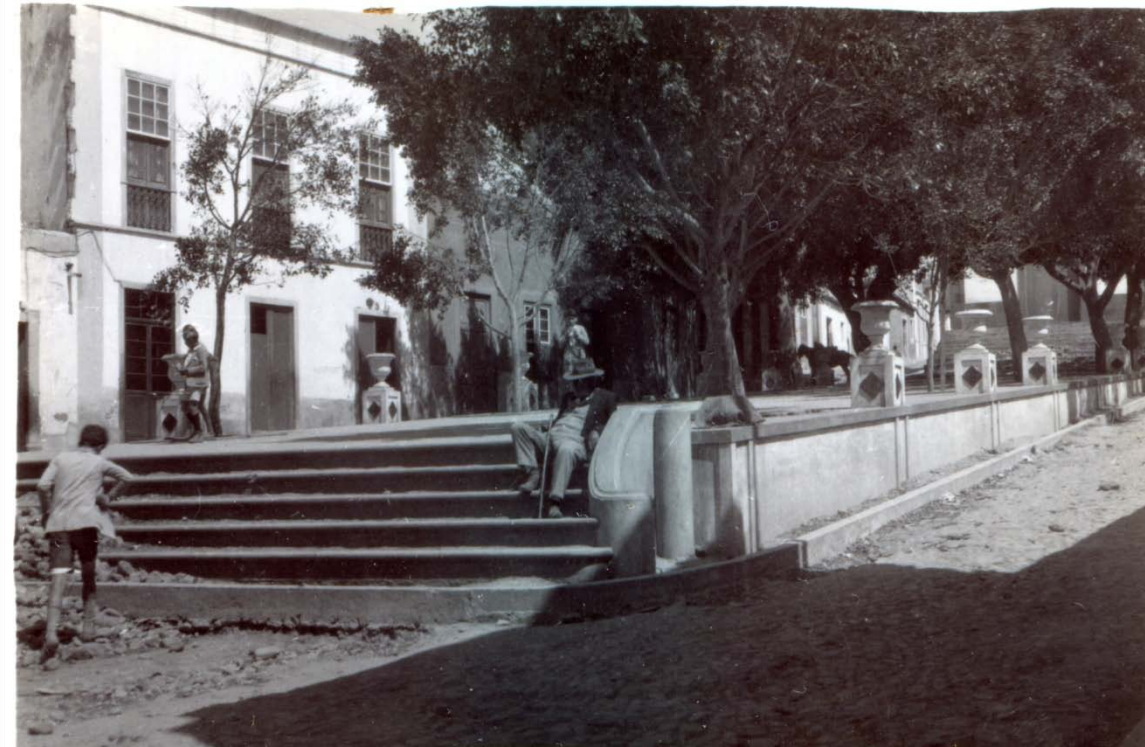
Plaza de San Roque 1929-1930.