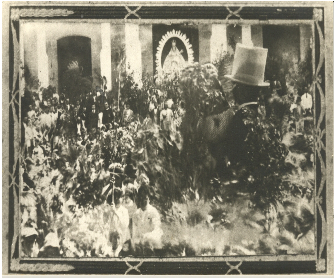
La Rama de las Marías de Guía a principios de siglo XX.

Donde se puede apreciar dos papagüevos, hoy desaparecidos