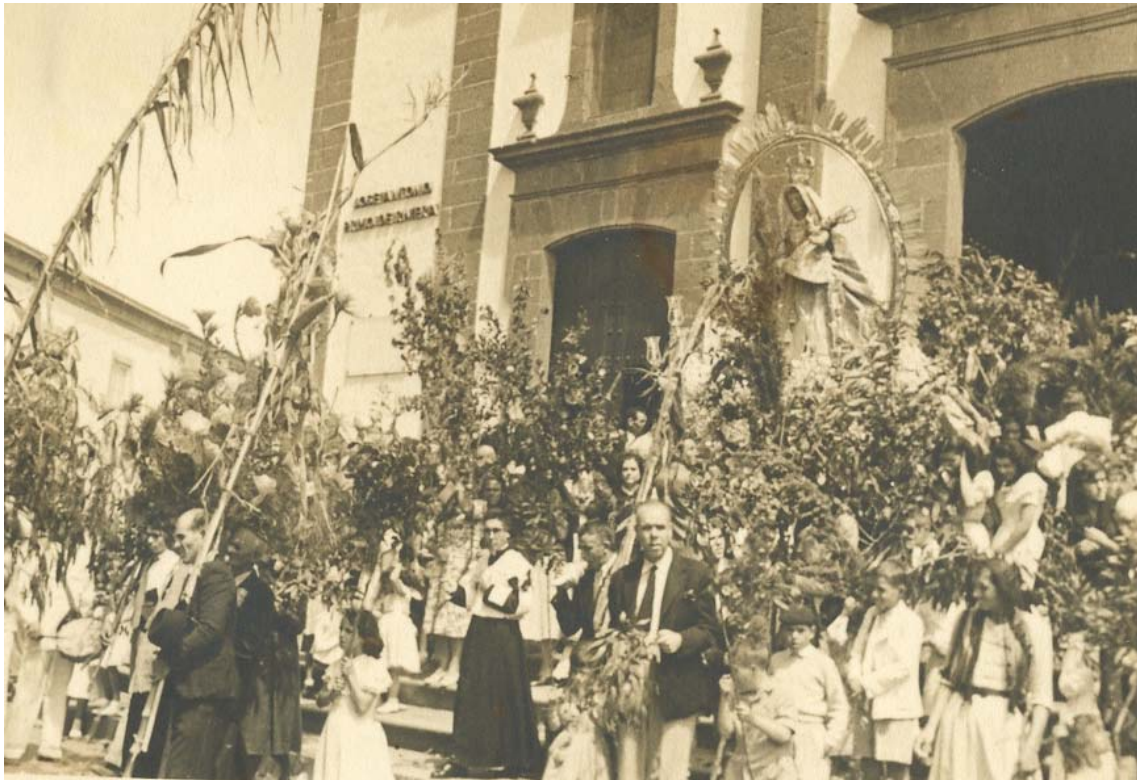
Las Marías, a finales de los años cuarenta del siglo XX con mayordomos portando ramas