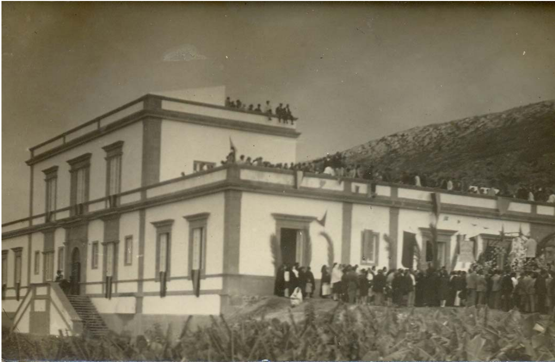
Inauguración del Hospital de San Roque en 1926.

ejecuto., haciendo de paso atinadas observaciones acerca de las salas de operaciones.