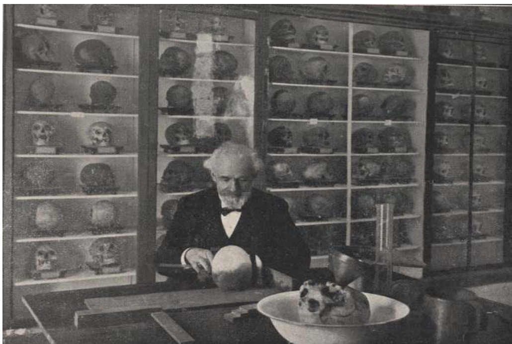
El Dr. Verneau en el Museo Canario.

René Verneau nació en La Chapelle (Francia) en 1852. Después de cursar estudios de botánica y antropología, realizó numerosos viajes a diferentes lugares de Europa, con objeto de estudiar razas antiguas. En marzo de 1876 es encargado por el Ministerio de Instrucción de una misión científica en el Archipiélago Canario. En 1884 hizo un nuevo viaje a las islas, permaneciendo en Canarias hasta 1888. Después de la publicación de su libro Cinco años de estancia en las Islas Canarias (1891) el científico francés visitó en varias ocasiones las islas. En el año 1926 volvió a Gran Canaria y en 1935 lo hizo por última vez, y a pesar de sus achaques, trabajó intensamente en El Museo Canario, del que fue socio de honor. El doctor Verneau, que falleció en París en 1938, escribió otros libros sobre Canarias, entre los que se pueden mencionar La Atlántida y los atlantes , Sobre la pluralidad de razas antiguas en el Archipiélago Canario , Los semitas en las Islas Canarias , Los antiguos habitantes de la Isleta , Viviendas y sepulturas de los antiguos canarios , Las pintaderas de Gran Canaria y Los guanches y los bereberes 1 .