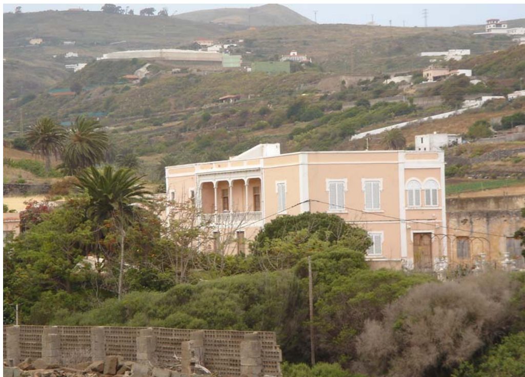
Casa perteneciente a la familia Guerra situada en San Juan.