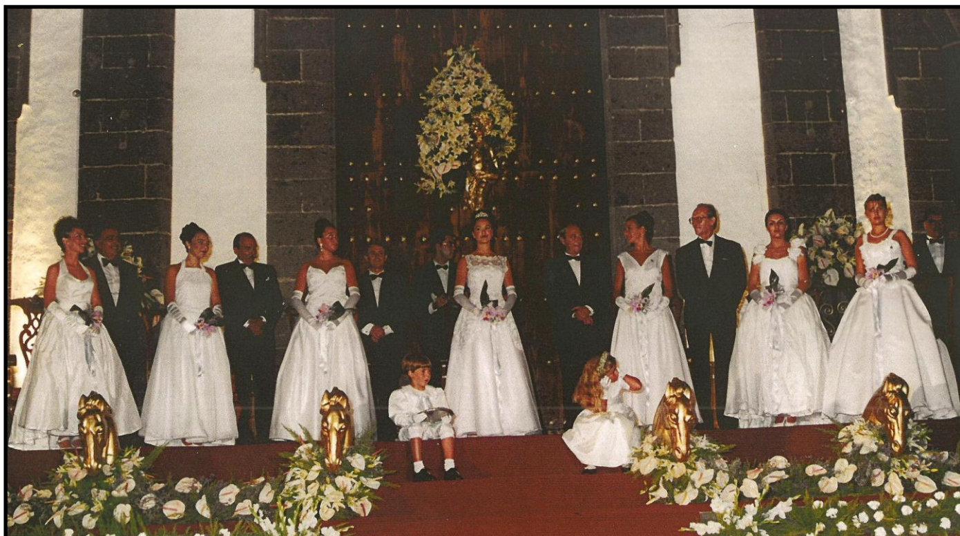
Foto: Acto de clausura de los Juegos Florales de Guía de 1996.

su día grande el próximo jueves, son un exponente de que la actividad del verano no se agota en las playas ni tumbados al sol, la creatividad juvenil ofrece la oportunidad de descubrir la vitalidad de los pueblos, y de acercar la mirada a la cultura popular”.