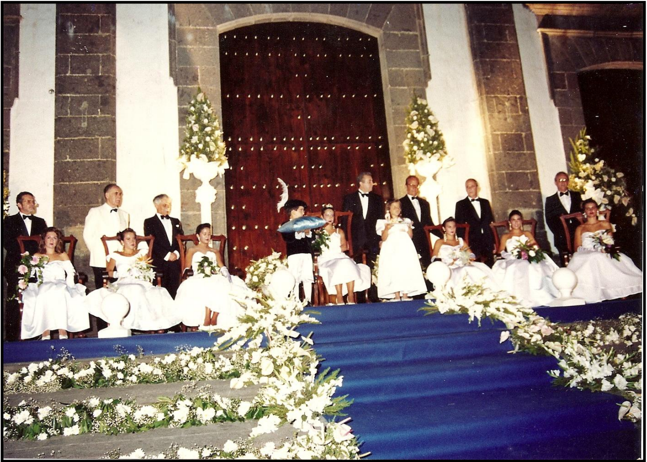
Foto: Acto de clausura de los Juegos Florales de Guía de 1990.

El periódico Canarias7, en su edición del lunes 11 de junio de 1990, expresaba lo siguiente 83 :