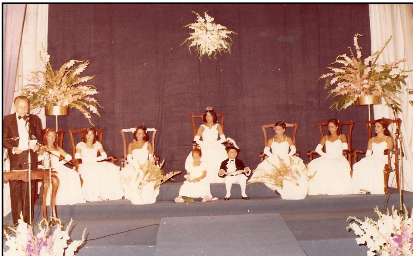
Foto: Discurso de D. Ricardo de la Cierva, Mantenedor de los Juegos Florales de 1980.

Asimismo, el periódico “Eco de Canarias”, en su edición del martes 22 de julio de 1980, recoge 65 :