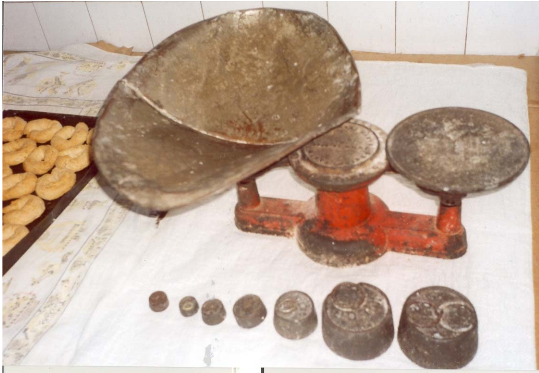
Pesas empleadas en la panadería de Isidro Pérez. Foto: Francisco Vaquero Arencibia (2008)

En cuanto a la confección del pan por parte de panaderos, y especialmente panaderas, su labor también estaba regulada por las ordenanzas concejiles (AZNAR, 1992: 518-525). Otro oficio relacionado con la producción del pan era el de hornero, actividad también reglamentada por las Ordenanzas de Gran Canaria, donde se estipulaba el funcionamiento de los denominados "hornos de poya" por ser el derecho que se pagaba en pan por utilizar el horno común. Además del pan podían llevarse a dichos hornos cazuelas, pasteles, hojaldres, tortas, membrillos y peras. (MORALES, 1974).