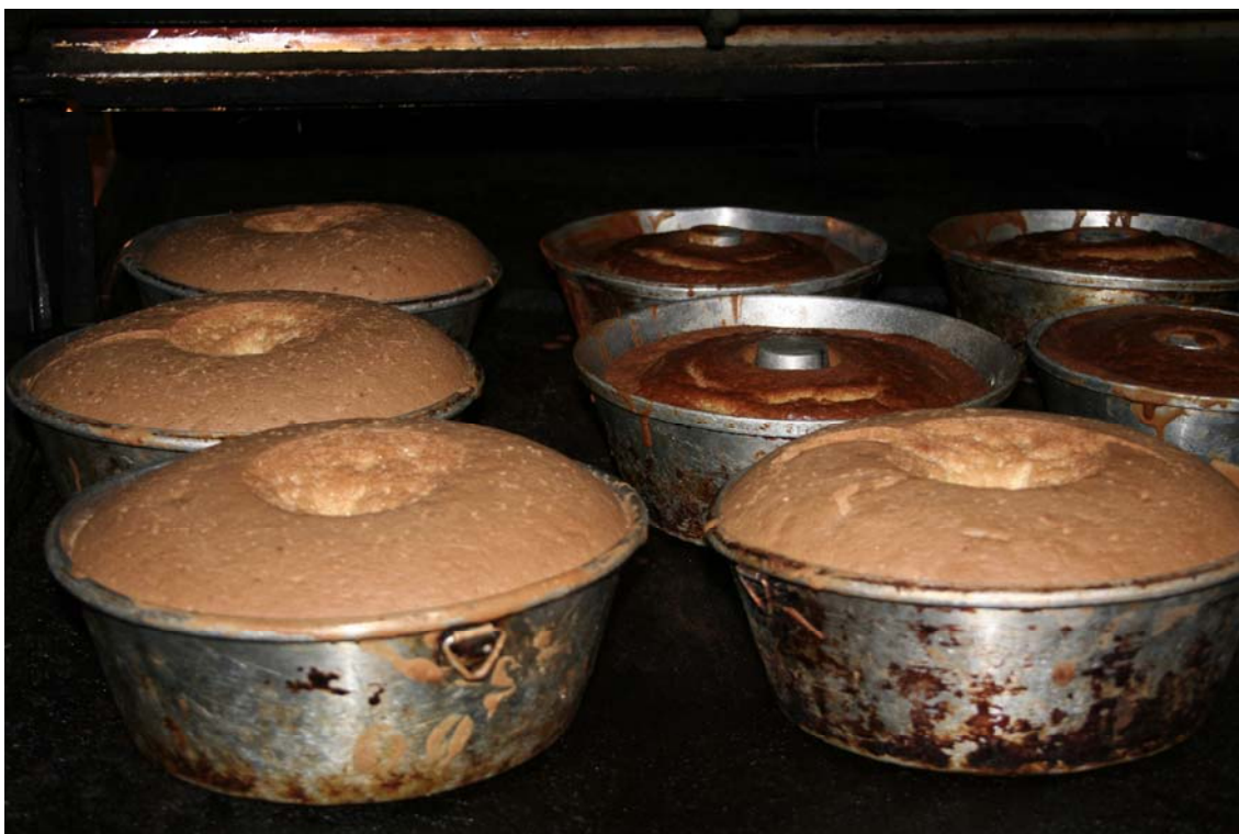
Queques elaborados en la panadería de Antoñita. Foto: Javier Estévez (2008).

perfumes, galletas y pasteles. (GONZÁLEZ, 1995: 62-63). Con los ingleses, además, llegó el pan de molde para la elaboración de sándwiches y en las pastelerías y restaurantes comenzaron a ofrecerse pudines, rosbeef o salsas, así como un gran surtido de galletas inglesas, cuyas marcas se fueron convirtiendo en muy familiares, y en parte de la dieta cotidiana, como es el caso del cake inglés, que se convertiría en el queque canario (GONZÁLEZ, 1995:247-248).