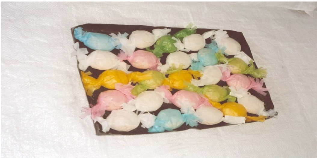
Polvorones elaborados en la "panadería de Chonita".

En abril y mayo de 1892 se celebra en la ciudad de Las Palmas de Gran Canaria la que se denominó Fiesta de las Flores , en la que prácticamente todos los municipios de la isla participaron exponiendo todo tipo de productos. En el reglamento elaborado por los organizadores para poder participar en esta fiesta, se estableció un apartado denominado "Productos de la panadería, pastelería, repostería y confitería" , señalando dentro de "Productos de la pastelería y repostería" a "Productos variados de pastelería. Pastelillos y tortas de todas clases, bizcochos y productos similares"