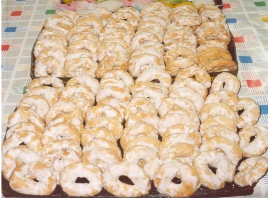
Bollos de refresco.