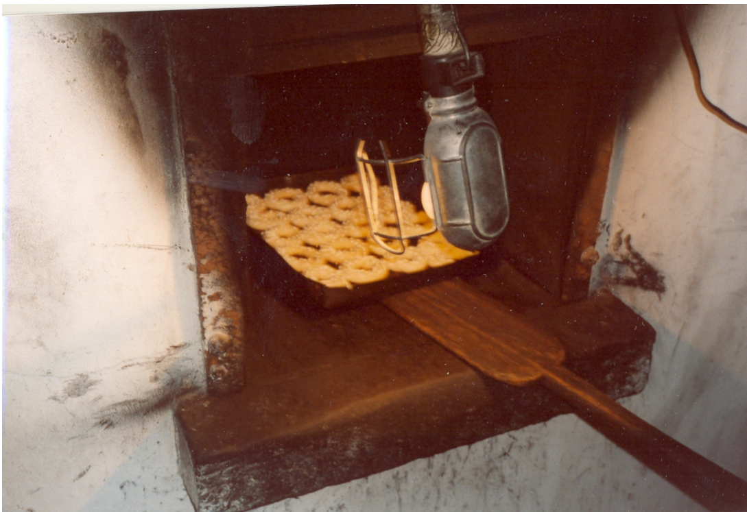
Dulces conocidos como de “pintitas” en el horno. Foto: Paco Vaquero Arencibia (2008)

en la repostería de la isla, la presencia de “monjas dulceras” de los conventos de Santa Clara, San Bernardo y San Ildefonso (ALZOLA, 2005: 50). Es tal el peso que las monjas tienen en la tradición repostera, que los nombres de muchos de los dulces nos indican su origen conventual, denominaciones que fueron importadas de monacatos de la Península, junto con las recetas. Son muchos los ejemplos: lenguas de obispo, huesos de santos, roscos de Santa Clara, bollos de alma, yemas de San Ildefonso, cabello de ángel, tocinos de cielo, suspiros de monjas, pasteles de gloria, capuchinas, torrijas de Santa Teresa, etc. (ALZOLA, 2005: 62).