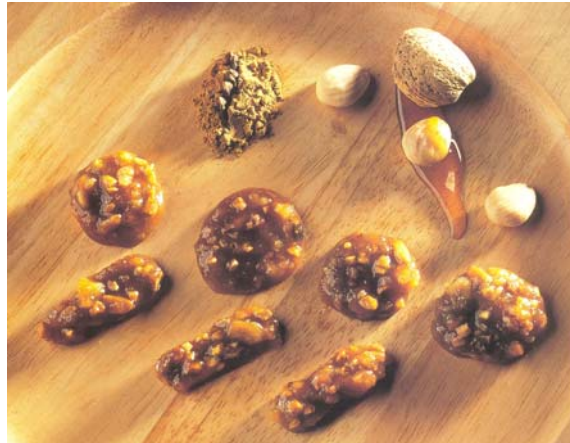
“Sopa ingenio”.

mantecados, tortitas de almendras dulces y amargas, bollos de refresco, etcétera”.