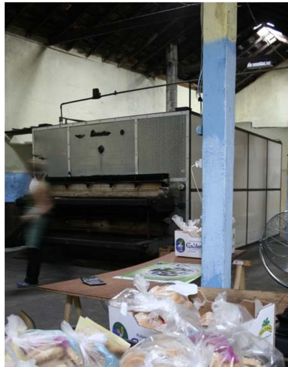
Hornos de la panadería de Antoñita antes de la familia Pons. Calle Pérez Galdós de Guía. A la Izq. el viejo horno, a la dcha. el horno actual. Fotos: Javier Estévez (2008).

Si en el año 1941 veíamos a los hermanos Antonio y Luz Ma a Mateos Osorio dándose de alta en el comercio de confitería, en julio de 1946 lo harán como " horno de confección de bizcochos, bollos, etc. " los dos en la calle Pérez Galdós nº 32.