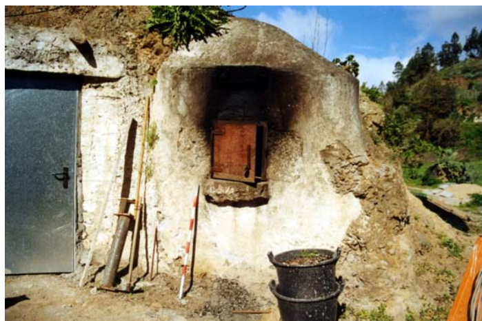
Horno situado en el Barranco del Pinar de Guía. Foto: Javier Estévez (2001)

Pero se daba el caso de que muchas de las personas que se dedicaban bien a la tarea de hacer pan, como a la de hacer dulces, no eran propietarios de hornos, cuestión que ocurría hasta bien avanzado el siglo XX, por lo que pagaban por hacer uso de los mismos a sus propietarios, si bien, era muy normal que en las casas hubiese un pequeño horno para las necesidades del hogar.