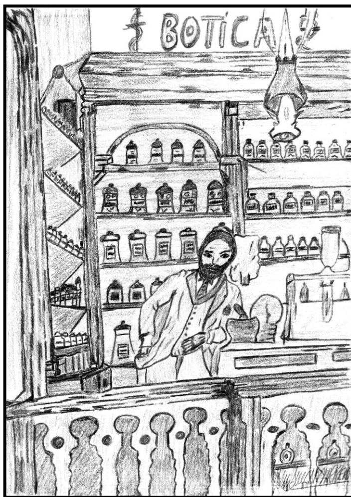
Botica de Santa María de Guía a comienzos del s.XX