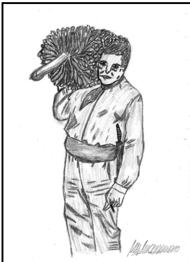
Trabajador de las plataneras con racimo de plátanos al hombro