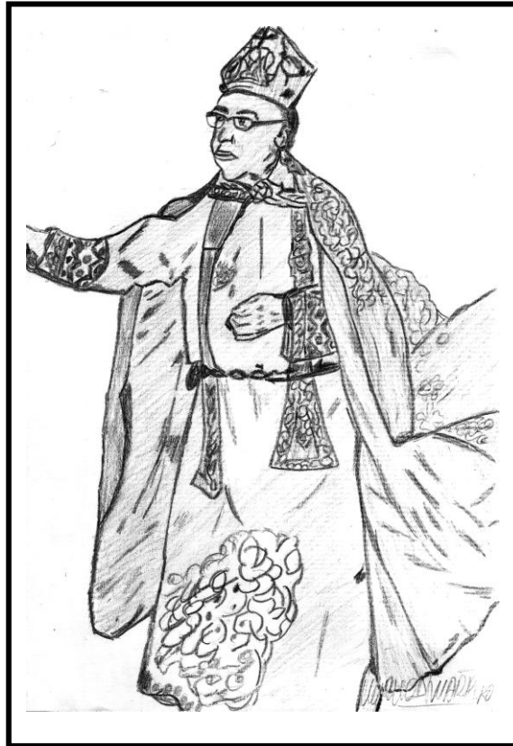
Sacerdote de Santa María de Guía (Dibujo realizado por Maruca Marrero) Archivo particular de Alejandro C. Moreno y Marrero

posible ignorancia- era un enemigo acérrimo de las procesiones, pero especialmente de la que se celebraba en honor del Sagrado Corazón de Jesús y siempre que llegaba esta festividad tenía sus "rifi rafes" con los mayordomos de la misma y, sobre todo, con el cura párroco, pues no quería que bajo ningún concepto saliera en procesión la venerada imagen.