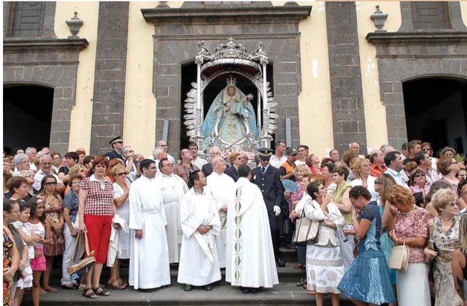
Batalla de Flores y salida de la Virgen de la iglesia.