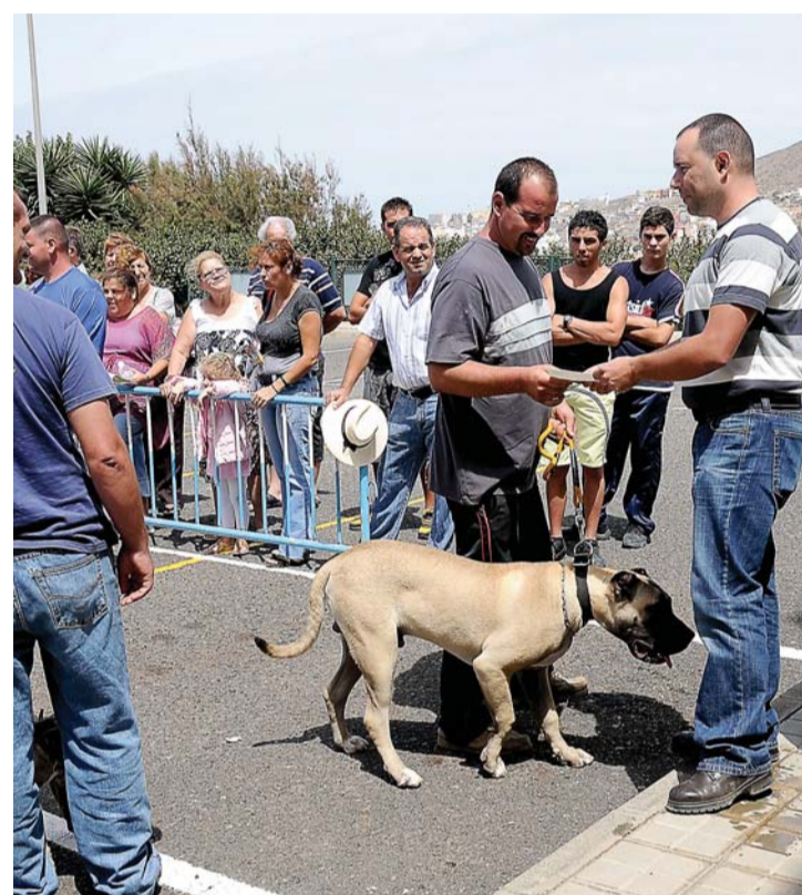
El edil en la muestra de Perros de Presa Canarios. | MATEOS

— Nuestra principal prioridad es la de finalizar el proyecto de reforma de la zona de las piscinas con la construcción de nuevas gradas. Sobre las gradas