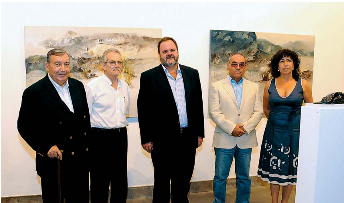
La cultura sustenta el futuro del municipio.

Santa María de Guía celebra estos días sus fiestas mayores, con la seguridad de estar pisando fuerte para conseguir ganar el futuro, que se presenta esperanzador