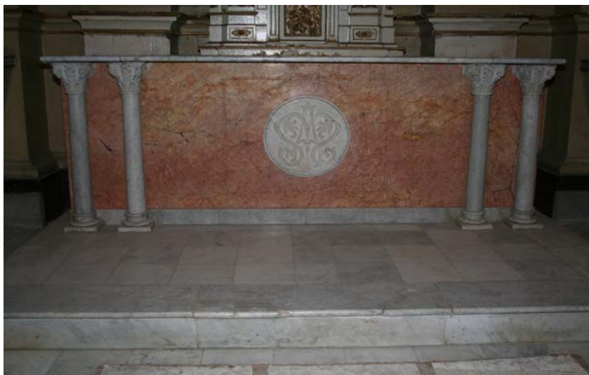
Detalle del altar mayor de la Parroquia de Guía con monograma Mariano

Por todo el tiempo se ha colocado un zócalo de más de un metro de altura de mosaico en colores haciendo juego con el pavimento de mármol, que poseía este templo, ofreciendo un agradable conjunto.