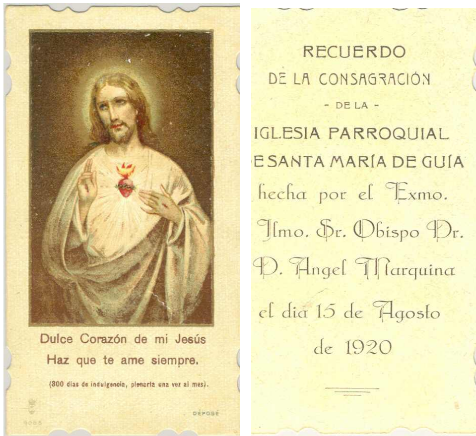
Recordatorio de la Consagración del templo de Santa María de Guía (1920)