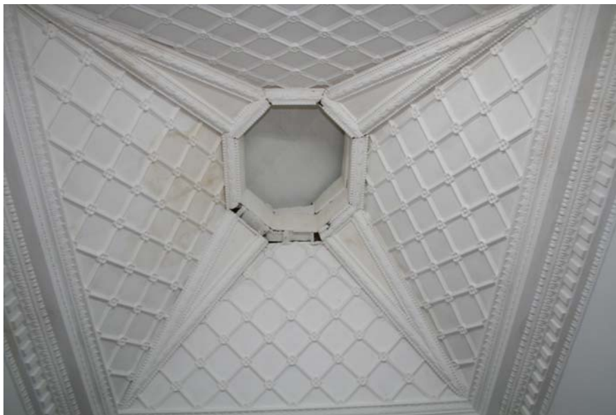
Detalle del techo del Baptisterio