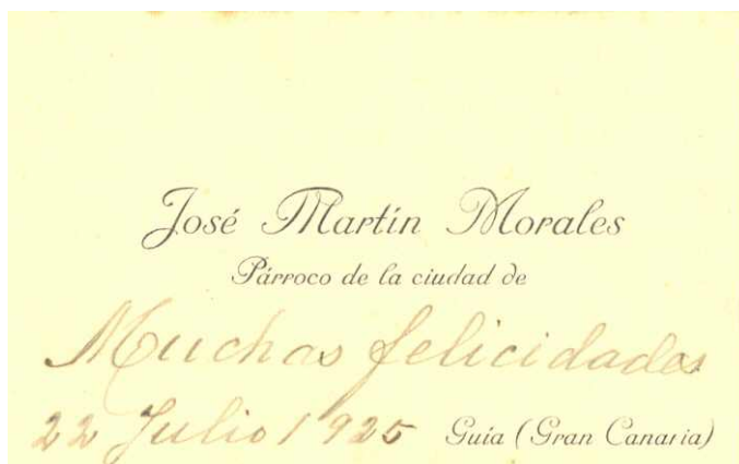
Tarjeta de Visita (1925)