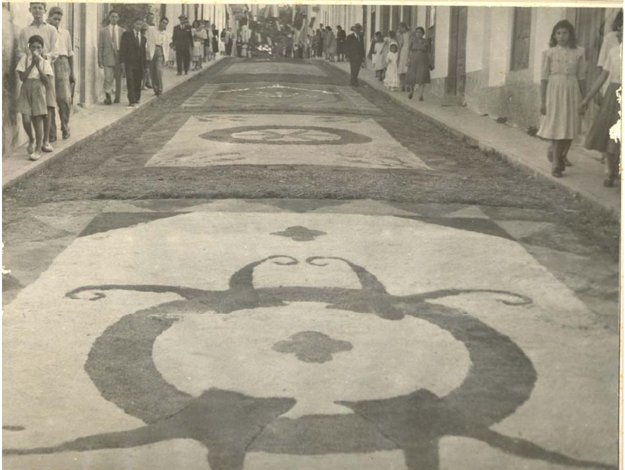
Corpus Christi año 1950 en Guía de Gran Canaria. Calle Médico Estévez