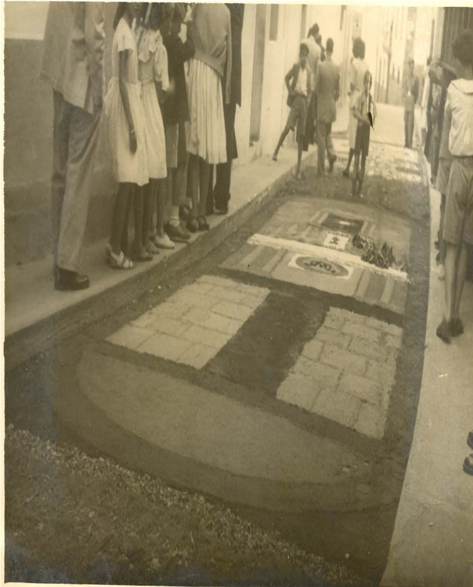
Corpus Christi año 1948 en Guía de Gran Canaria. Calle Canónigo Gordillo