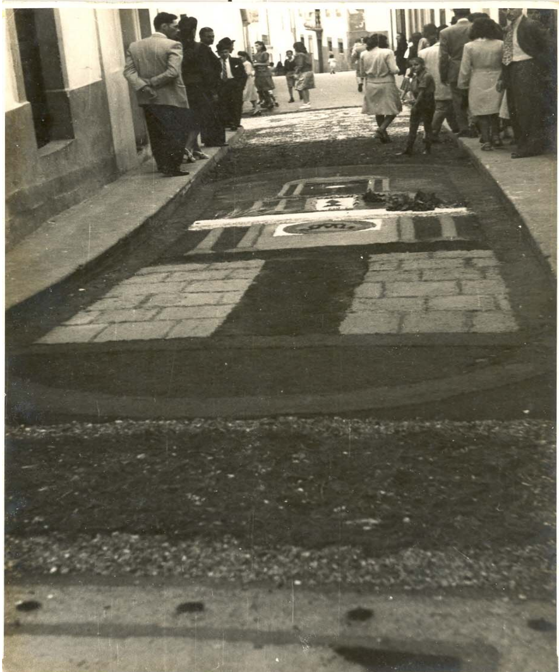
Corpus Christi año 1948 en Guía de Gran Canaria. Calle Canónigo Gordillo