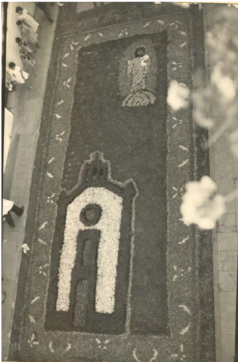
Corpus Christi año 1950 en Guía de Gran Canaria. Junto a La Plaza Grande