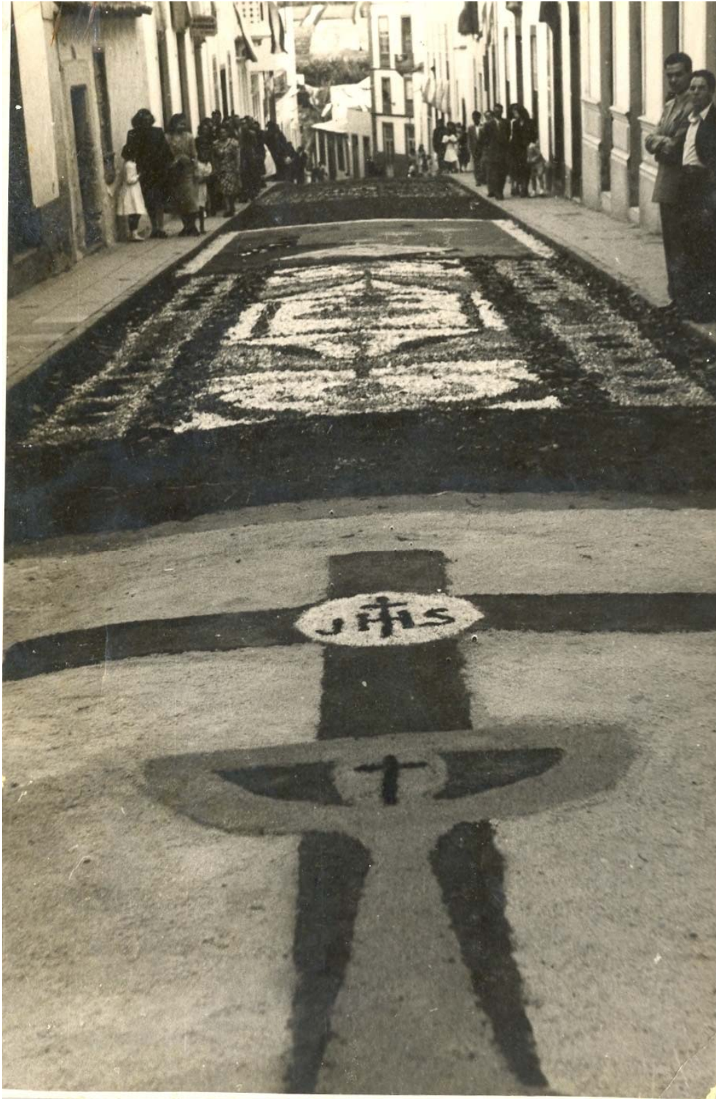
Corpus Christi año 1948 en Guía de Gran Canaria. Calle Médico Estévez