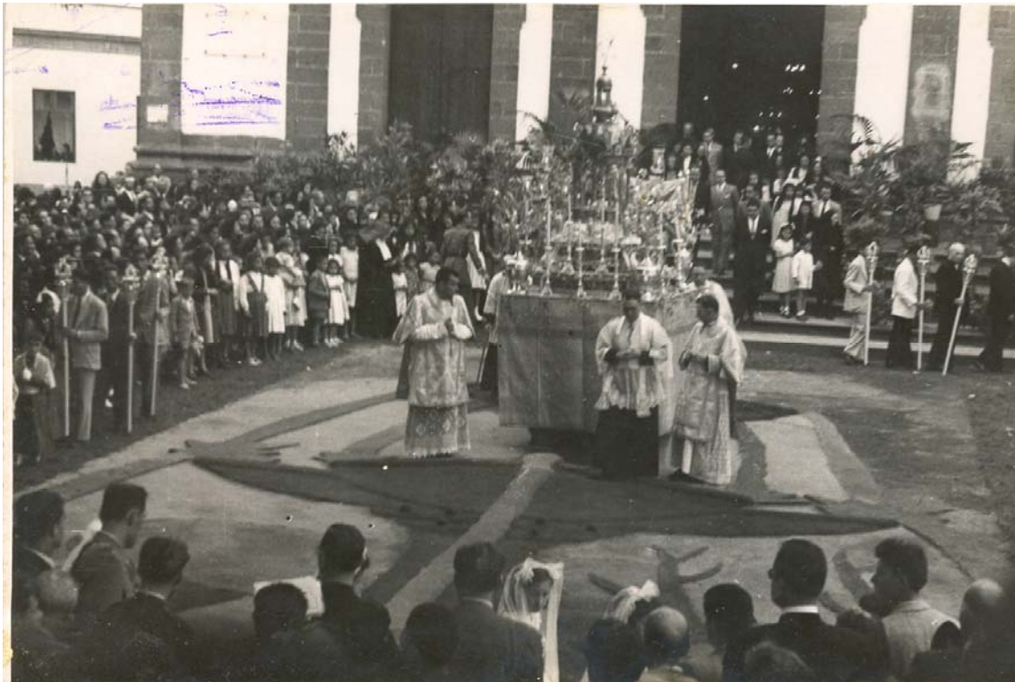
Corpus Christi año 1948 en Guía de Gran Canaria

La festividad del Corpus Christi tiene su origen a partir del Concilio de Trento y gozó de gran esplendor en los siglos XVII y XVIII, durante el periodo del Barroco. Según algunos historiadores, el origen de la fiesta hay que encontrarlo en la ciudad belga de Lieja en el siglo XIII donde, según la leyenda, una monja tuvo la visión de una luna llena ensombrecida por una de sus partes, lo que fue interpretado como que la Iglesia estaba triste por la falta de una fiesta que honrase al Cuerpo de Cristo Sacramentado.