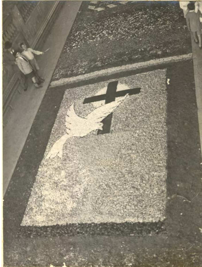
Corpus Christi año 1950 en Guía de Gran Canaria. Junto a La Plaza Grande