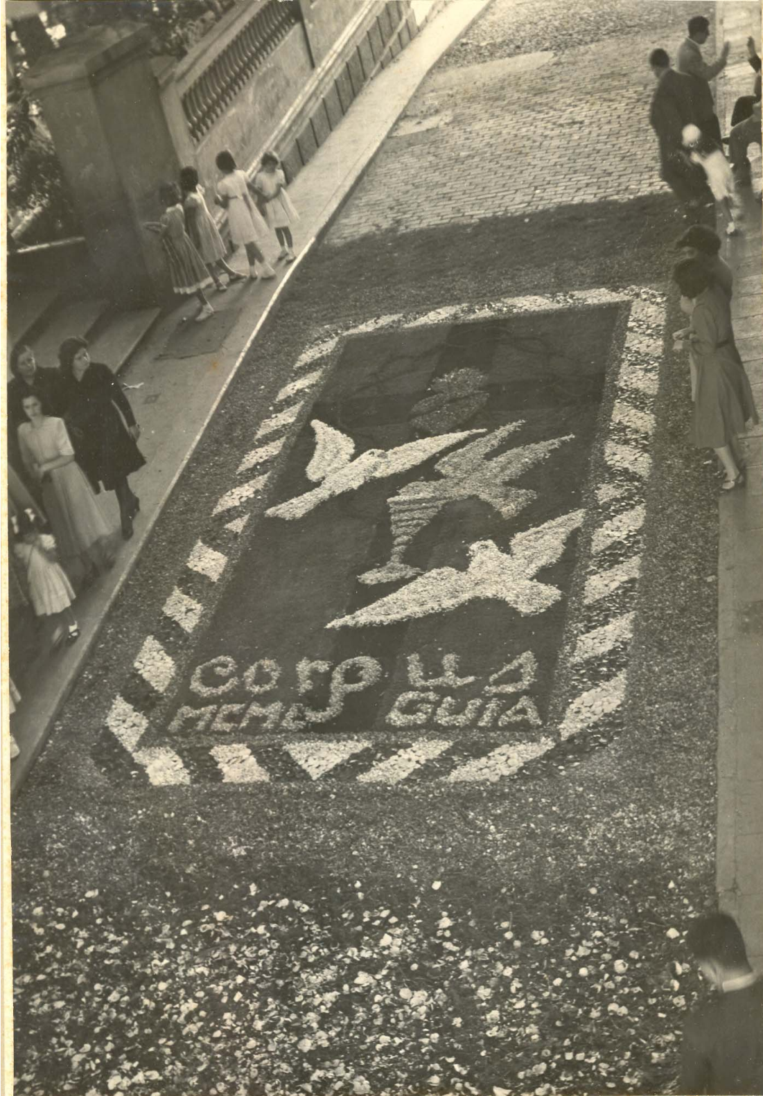
Corpus Christi año 1950 en Guía de Gran Canaria. Junto a la Plaza Grande