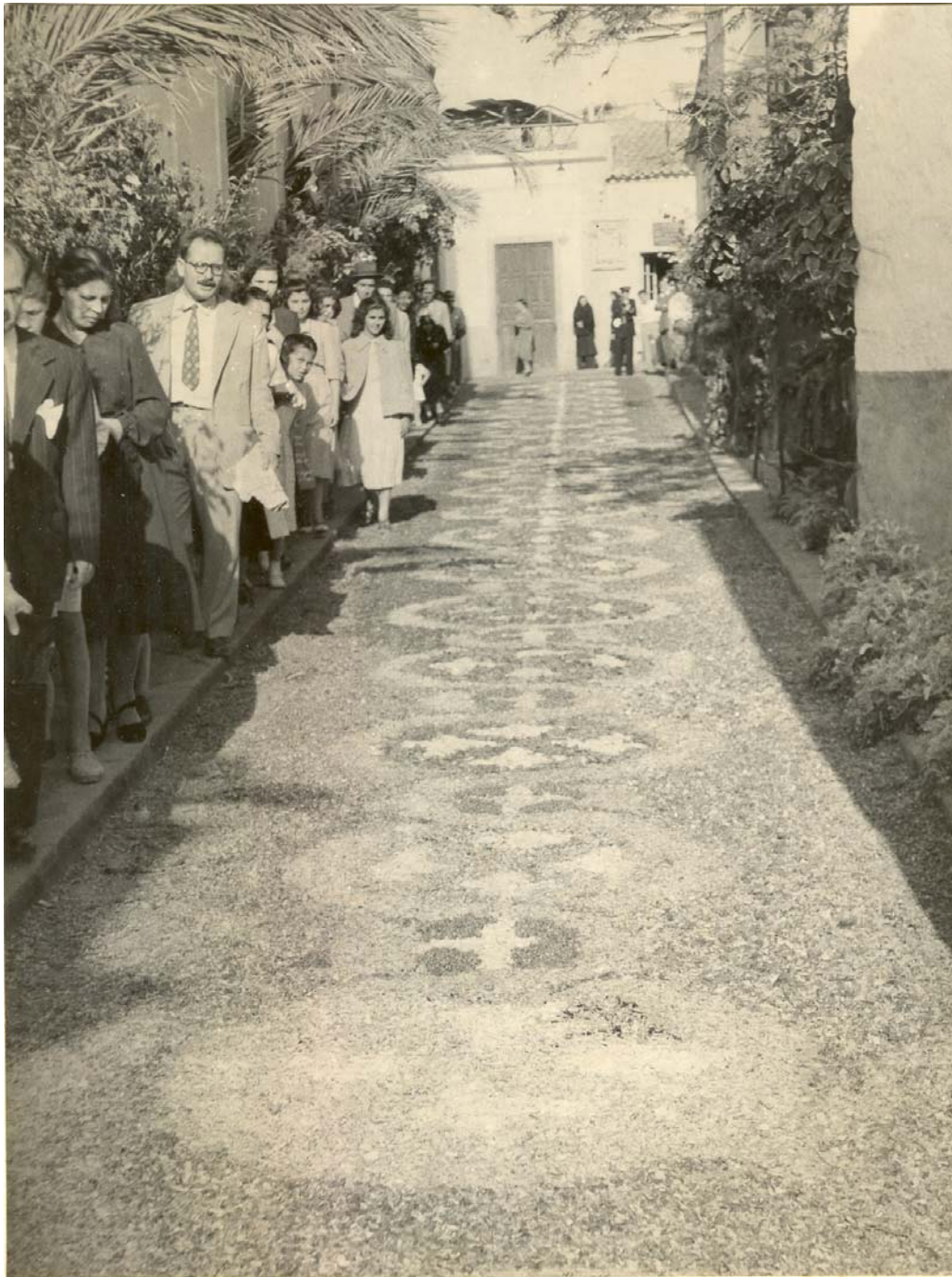
Corpus Christi año 1950 en Guía de Gran Canaria. Calle San José

Dice un viejo dicho: "Tres jueves hay en el año que relucen más que el sol, Jueves Santo, Corpus Christi y el día de la Ascensión". Sin embargo, esta fiesta religiosa ha venido a menos en los últimos años. Ahora ya no es un día festivo y se celebra en domingo en lugar de en jueves.