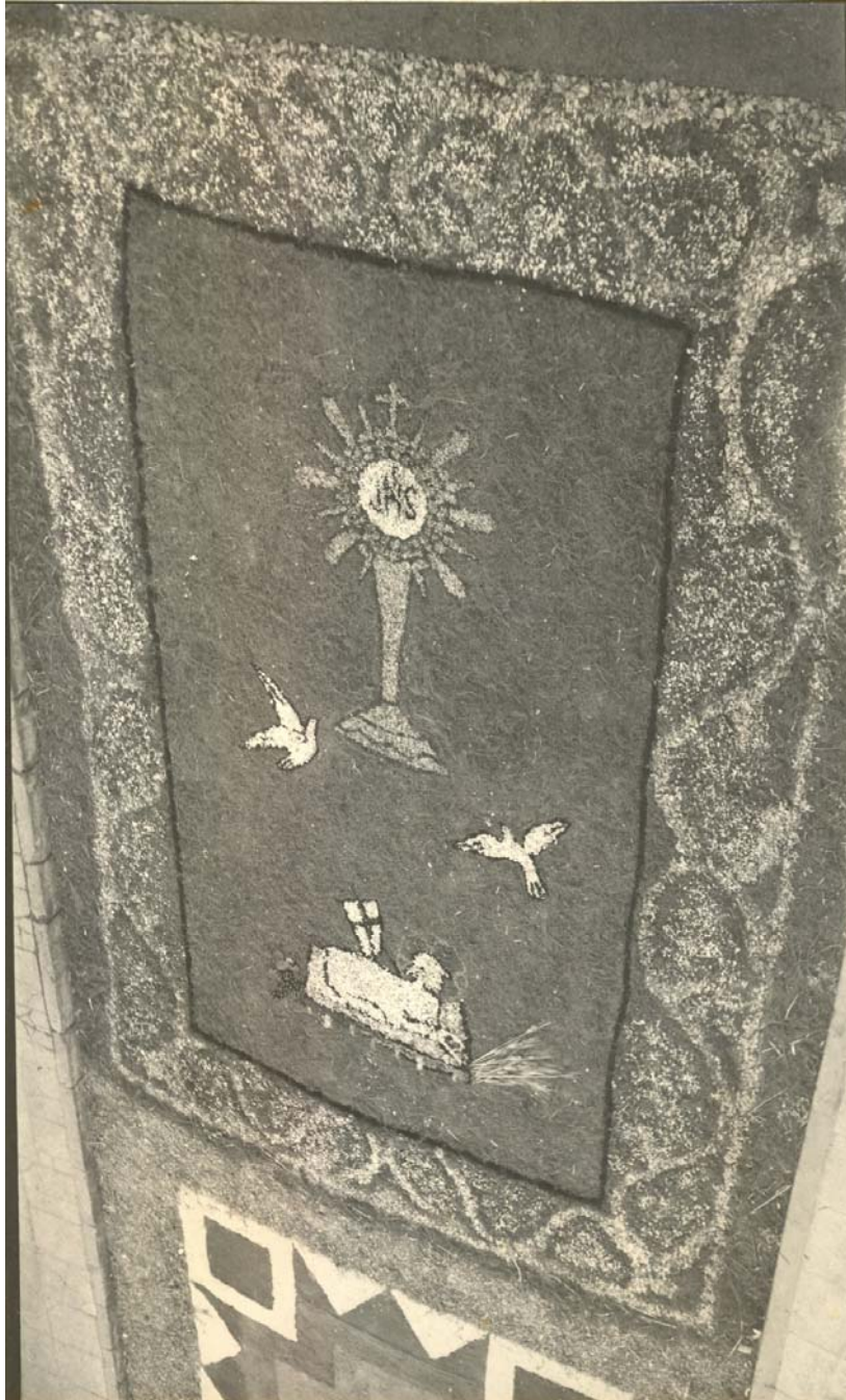
Corpus Christi año 1950 en Guía de Gran Canaria.