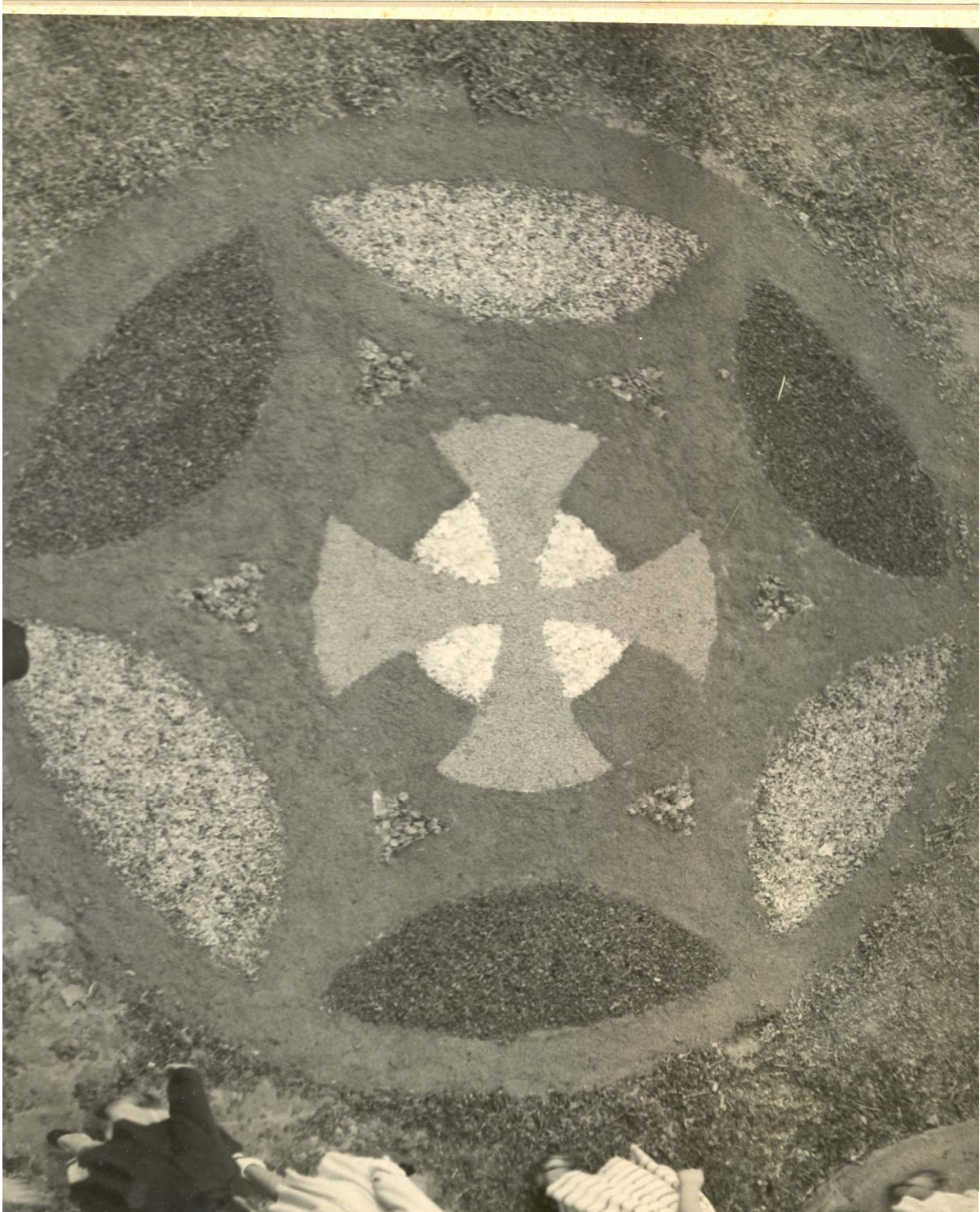
Corpus Christi año 1950 en Guía de Gran Canaria.