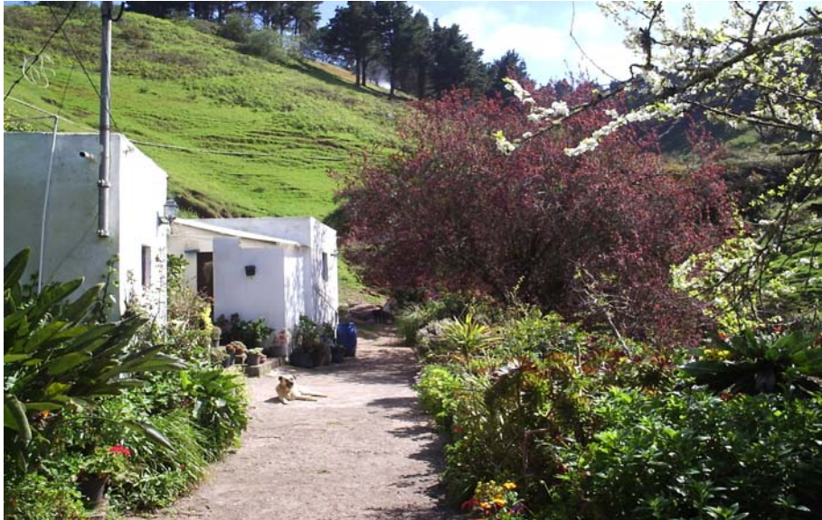
Cortijo de Lomo Gordo en Guía de Gran Canaria (2006)

Santa María de Guía: El término municipal limita con Moya por el levante y con Gáldar por el sur y oeste. Por el lado septentrional linda con el océano. Cuenta con una extensión de 37,72 km 2 y tiene forma de triángulo irregular con vértice principal en el interior de la isla (exactamente en la isohipsa de los 1.500 m), declinado gradualmente hacia la costa en acusada pendiente de más de 11,5%.