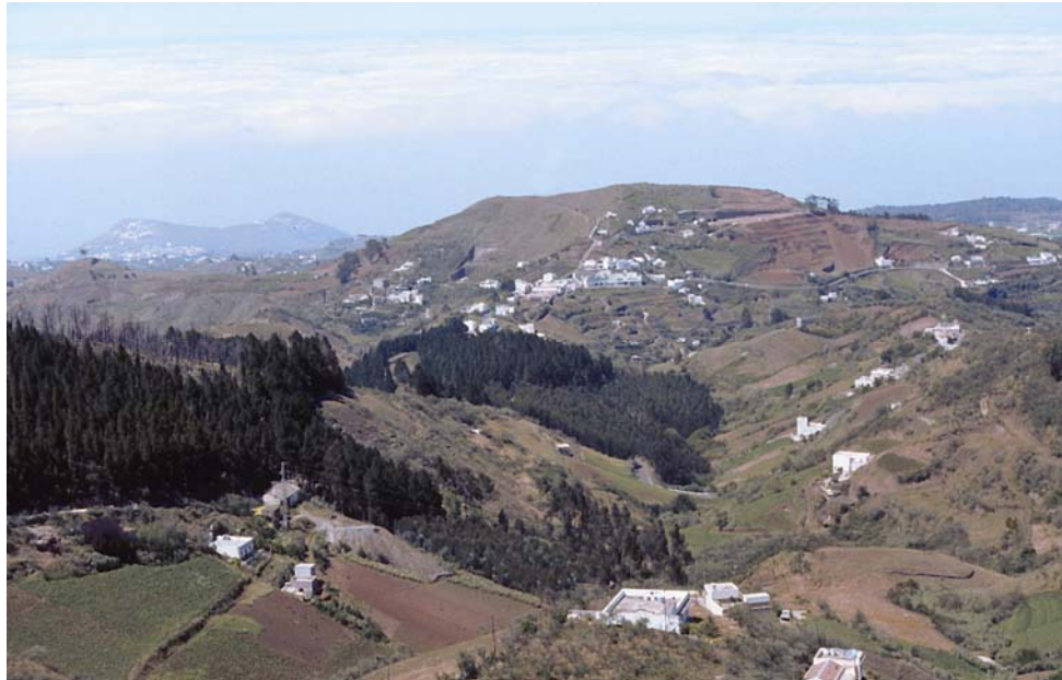
Montaña Alta (1998)