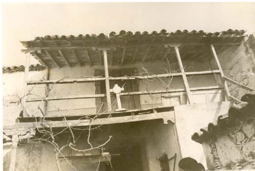
Antigua Casa de las medianías de Guía. Con quesos madurándose en el cañizo.

El queso que se produce en los municipios de Gáldar, Moya y Santa María de Guía presenta una estacionalidad muy marcada y altamente arraigada con el sistema tradicional de producción. Esta característica es fundamental y marca el período de producción. Por tanto, para que los quesos puedan ser amparados deberán ser producidos en el período comprendido entre los meses de enero a julio.