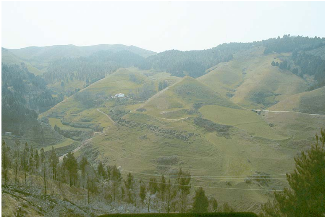
Cortijo "El Gusano"

ZONA GEOGRÁFICA: La zona de producción de la leche apta para los productos amparados por esta denominación de origen coincide con la zona de elaboración y maduración y se circunscribe a tres municipios de la Comarca noroeste de Gran Canaria, que son: