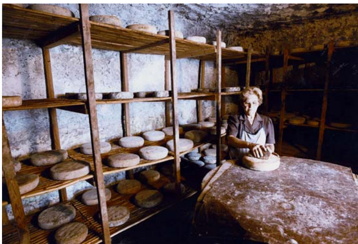
Cueva de maduración del queso de Guía