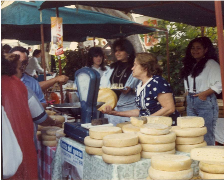
Fiesta del Queso año 1988