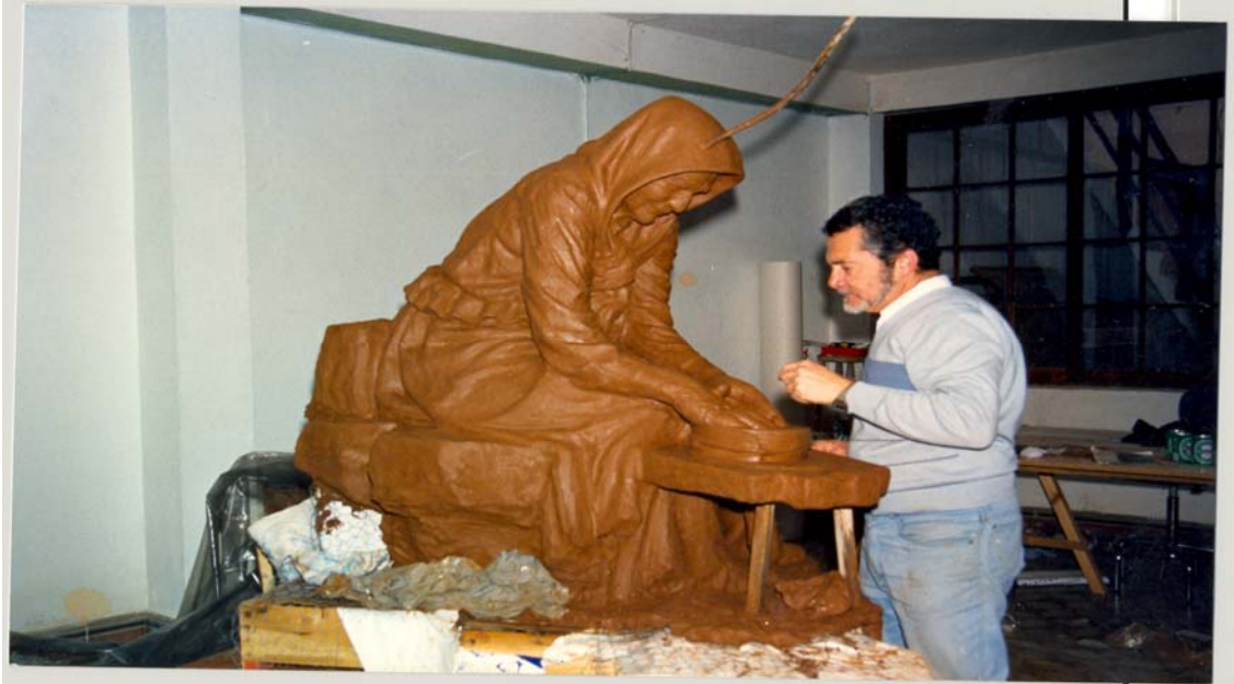
Monumento a la Artesanía realizado por el profesor y escultor guiense Cayetano Guerra Aguiar, que se encuentra en el casco histórico de Guía. Inaugurado en el año 1989.