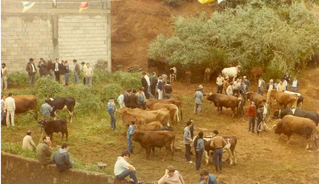
Feria de ganado de Montaña Alta. Década de los 80 del siglo XX

Moya: El municipio de Moya, enclavado en la parte central del Norte de Gran Canaria, cuenta con una superficie de 36,3 km 2 . Recibe esta denominación del antiguo marquesado, que allí tenía ubicados sus predios. Por la parte septentrional da hacia el mar, por el levante limita con Arucas, Firgas y Valleseco, por el lado sur linda con los municipios de Artenara y Tejeda, así como una diminuta porción de los altos de Gáldar, y por poniente bordea únicamente con el término de Santa María de Guía.