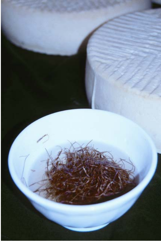
Preparación del cuajo vegetal con capítulos florales secos

Los quesos amparados según el grado de maduración, se clasifican en: