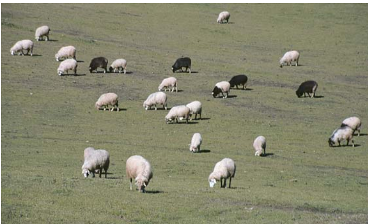
Ovejas pastando en los Cortijos de los Altos de Guía