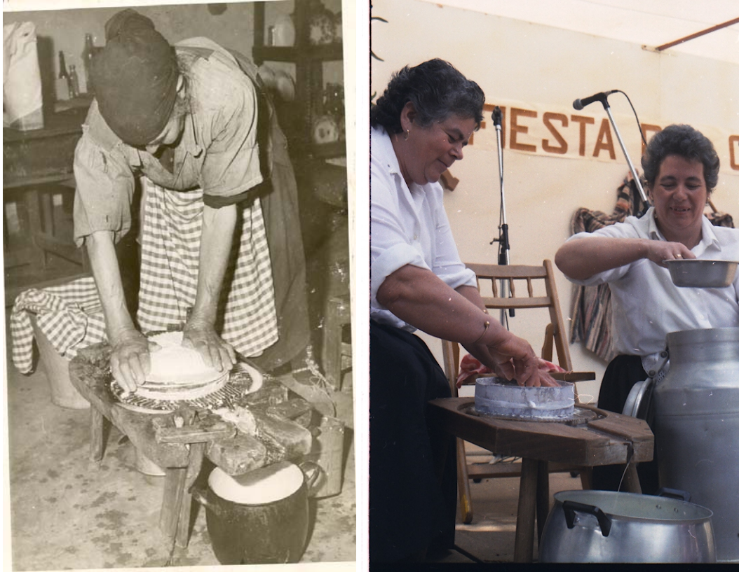
Artesanas elaborando el Queso de Guía

QUESO DE GUÍA: graso o semigraso. Es elaborado fundamentalmente con leche de oveja canaria admitiéndose, no obstante, la mezcla de leche de oveja con la de otras especies, siempre que se respeten las siguientes proporciones: