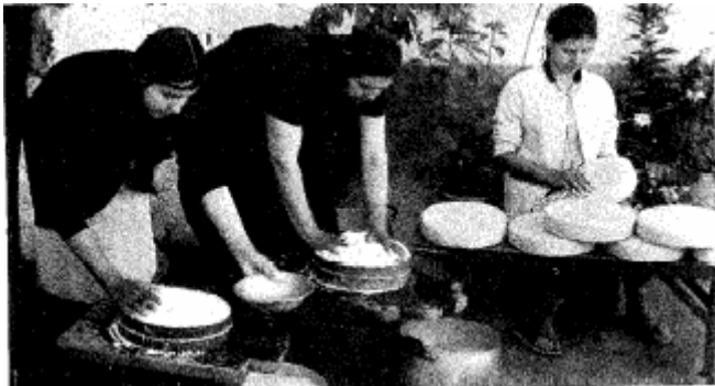
Artesanas elaborando el Queso de Flor de Guía