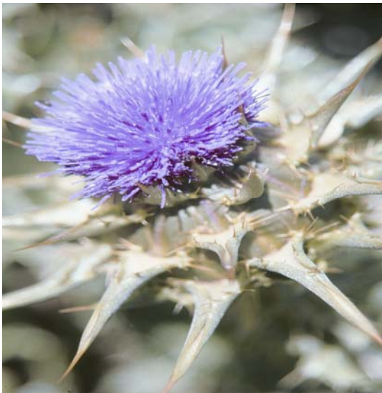
Cardo Cynara cardunculus var. Ferocísima y Cynara scolymus

Su principal característica radica en que la coagulación de la leche se realizará exclusivamente con cuajo vegetal obtenido de los capítulos florales secos de las variedades de cardo Cynara cardunculus var. Ferocísima y Cynara scolymus .