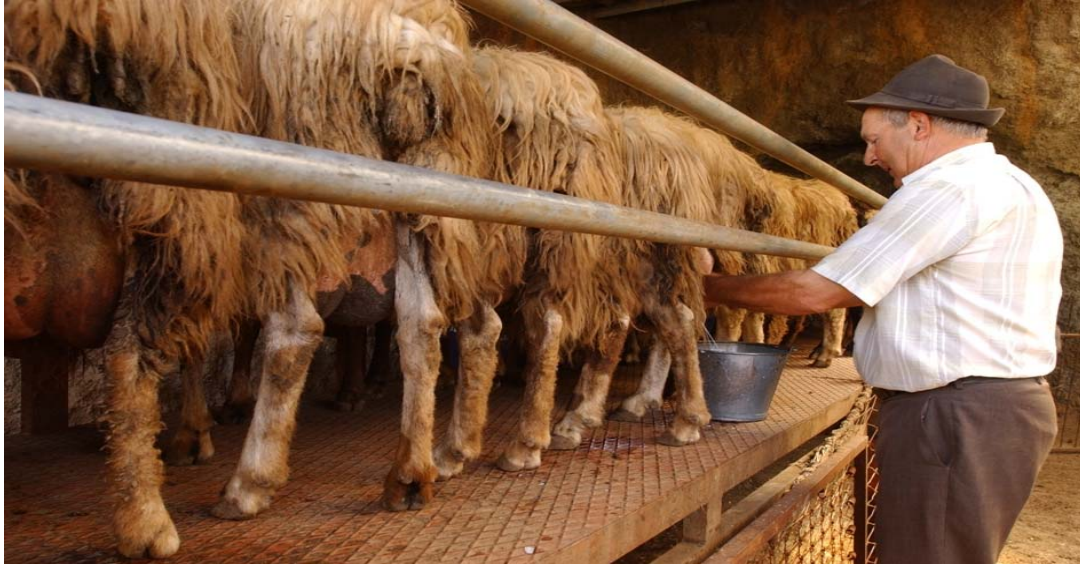
Ordeño de ovejas. Cortijo de Lomo Gordo