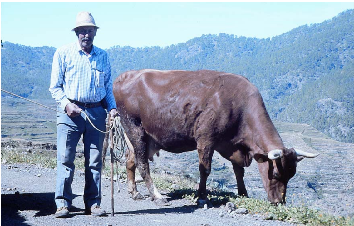
Ganadero en el Cortijo de Palominos (Gáldar)