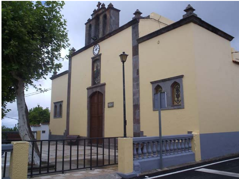
La ermita de S. José de la Montaña fue creada en el año 1916 y erigida en Parroquia en 1940

Pero si singular ya era de por sí la nueva Fiesta del Queso, aquél mismo día, y por la tarde, la Parroquia de San José de la Montaña fue protagonista de una "boda canaria". Los contrayentes acudieron en una carreta con la vestimenta típica de la zona, así como un nutrido grupo de invitados, al finalizar esta boda los padrinos de los novios ofrecían a los invitados trozos de pan y queso de Guía, volviendo el nuevo matrimonio a marcharse en la carreta que los había conducido a la iglesia.