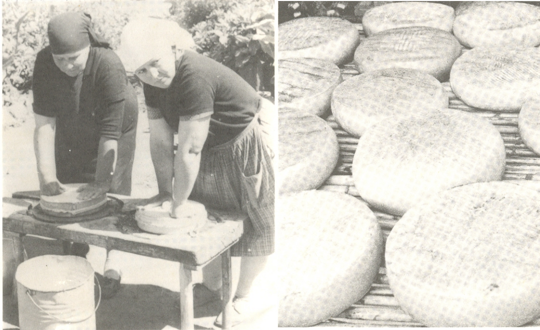
Artesanas queseras y quesos de Guía "curándose" en cañizos