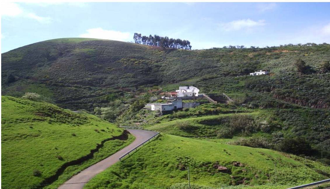
Cortijo "El Marqués" en Guía (2006)

Moya: El municipio de Moya, enclavado en la parte central del Norte de Gran Canaria, cuenta con una superficie de 36,3 km 2 . Recibe esta denominación del antiguo marquesado, que allí tenía ubicados sus predios. Por la parte septentrional da hacia el mar, por el levante limita con Arucas, Firgas y Valleseco, por el lado sur linda con los municipios de Artenara y Tejeda, así como una diminuta porción de los altos de Gáldar, y por poniente bordea únicamente con el término de Santa María de Guía.