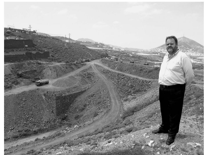
Obras de la carretera en el entorno de Llano Alegre, en Guía.