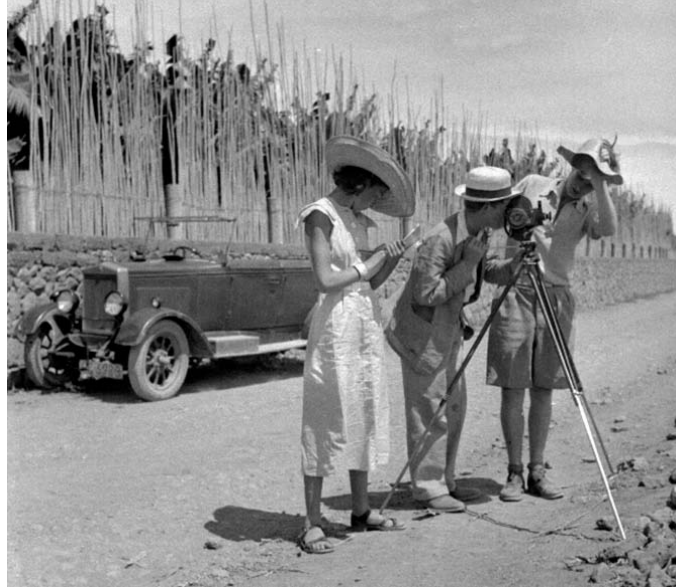
Richard Leacock filmando Canary Bananas en el Agujero de Gáldar

El documental refleja fielmente el cultivo y el manejo del plátano, pero según le comentó recientemente a un amigo común, “no te daba la sensación de estar en el lugar”, por lo que creía que había llegado el momento de añadirle sonido, y había pensado que el más indicado era la música tradicional canaria, concretamente la música de Néstor Álamo.