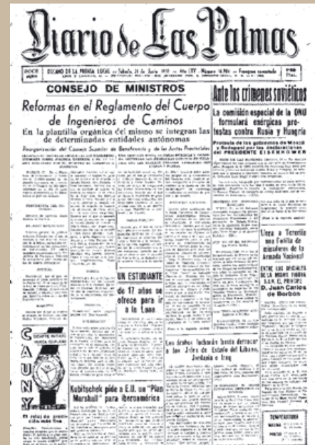
Primeras páginas de DIARIO DE LAS PALMAS y LA PROVINCIA

LLEGA A TENERIFE SAR DON JUAN CARLOS DE BORBÓN. En la misma página se comentaba la llegada al puerto de Santa Cruz de Tenerife de una flotilla de minadores de la Armada Nacional contando entre los oficiales de la misma a SAR el Príncipe Don Juan Carlos de Borbón en viaje de prácticas junto a otros alumnos de la Escuela Naval.