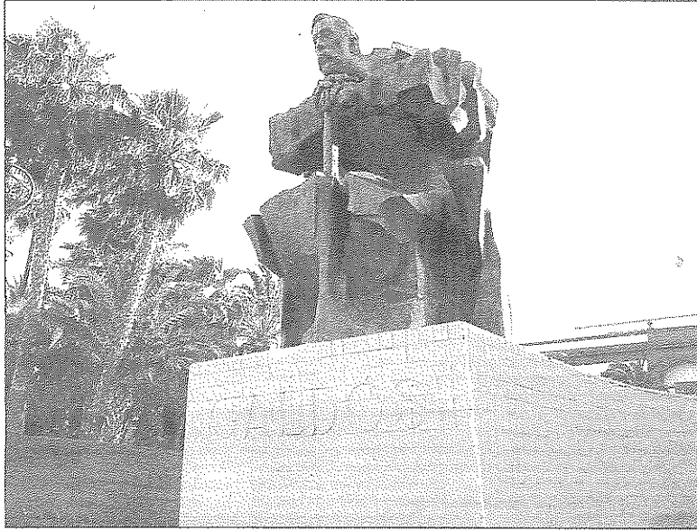
Imagen de la escultura de Benito Pérez Galdós, en la plaza de La Feria, en la capital grancanaria.

"Es una verdadera pena que los cántabros no hayamos podido mantener los recuerdos del paso de Galdós por nuestra región, que la Guerra Civil frustrara el proyec-