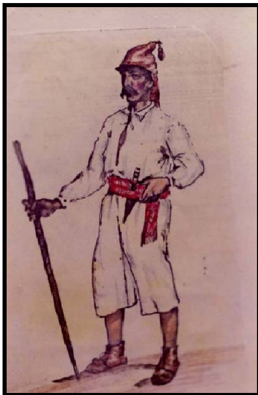
Campeſino de Gran Canaria con cuchillo a la cintura Dibujo: Fondo José Antonio Pérez Cruz, F.E.D.A.C.

Carmen Laforet, en su obra "La isla y los demonios", recogía "Un hombre flaco, de bigotes grises y caídos, afilaba una caña con un Cuchillo Canario, sentado en la puerta de su casa" .