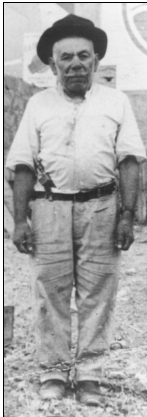
Marchante de Gran Canaria con cuchillo al calzón

navajas y cortaplumas puntiagudos, cuyas hojas no pasen de 11 cm. medidos desde el borde del mango que las cubre hasta la punta, y en la inteligencia de que la longitud de éste no pueda exceder del lógicamente necesario para cubrir la hoja". 3. "Las que los pastores y obreros de campo utilicen como necesarias para la comida y trabajos en que tomen parte". Dice también que "se prohíbe la fabricación, importación, venta, uso y tenencia de las armas blancas que no tengan aplicación conocida". En esta ocasión, nuestro Cuchillo Canario no está entre las armas blancas prohibidas, pues, sabido es que se trata de un instrumento tradicional indispensable para el agricultor y ganadero insular. Asimismo, tal y como reza en las líneas finales de dicha disposición, los maestros cuchilleros canarios (al tratarse de una herramienta para la labranza así como para el cultivo del plátano y, por tanto, con aplicación conocida) tienen vía libre para su fabricación, importación y venta.