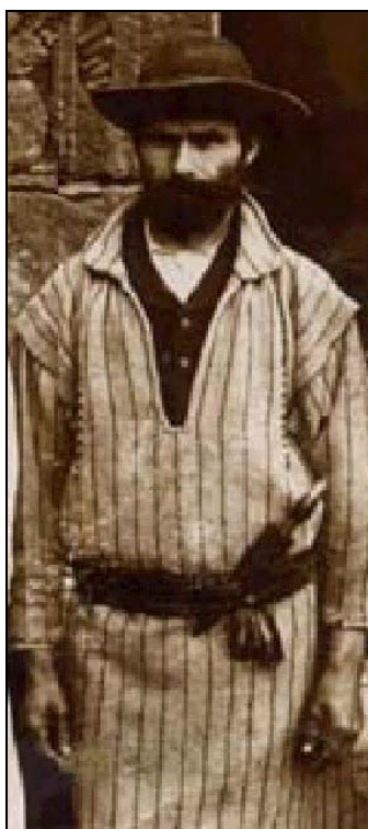
Labriego grancanario del s.XIX con cuchillo atravesado