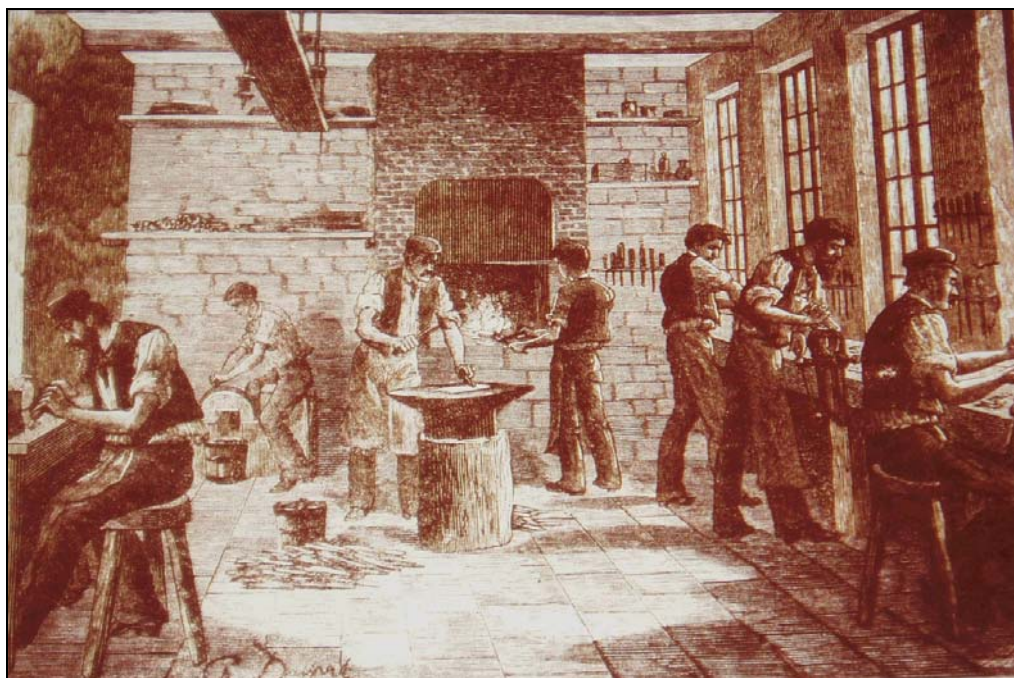
Taller de cuchillería del s. XIX

La Pragmática de Felipe V, dada en Lerma el 21 de diciembre de 1721, expresa “queda prohibido en toda España el uso de puñales y cuchillos, condenando, por el sólo hecho de la aprehensión con ellos, a 30 días de presidio, 4 años de destierro y 12 ducados de multa” . En 1722, el Consejo de Castilla completaba el contenido de la citada pragmática publicando un Bando en el que “se notifica a los cuchilleros que no fabriquen este tipo de armas y rompan las existentes, y a los comerciantes, que no las vendan” .